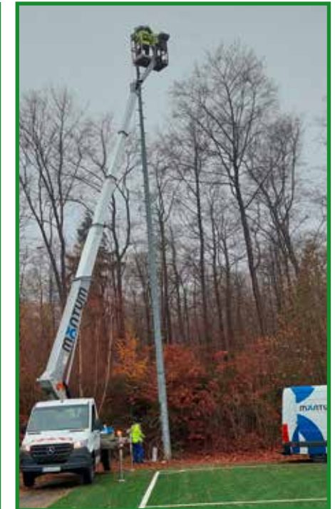
Umrüstarbeiten bei „Wind und Wetter“