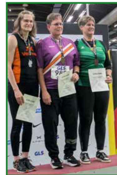
Bei der Siegerehrung...

So kann man abschließend feststellen, dass sie für die kommende Sommersaison gut gerüstet ist.