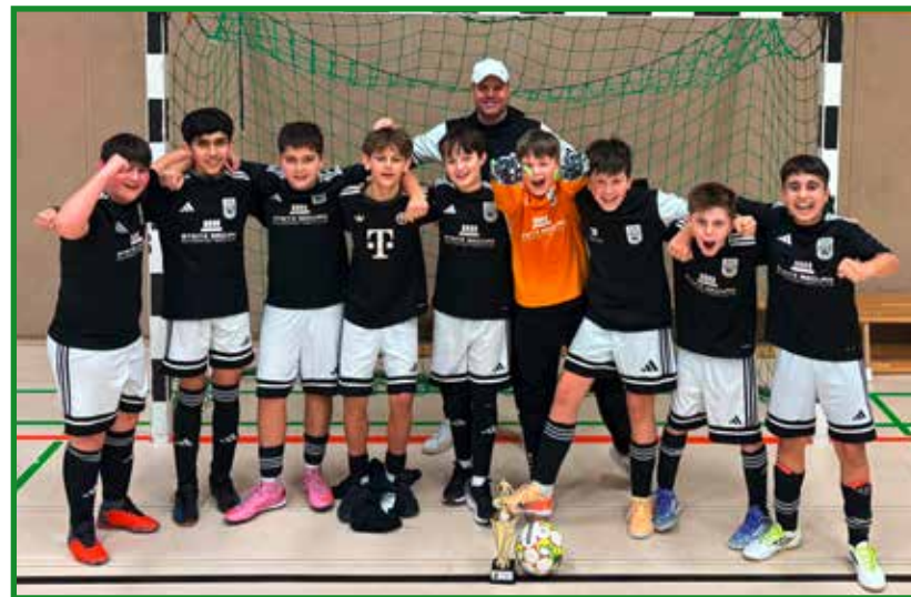
So sehen Sieger aus...

Neben den sportlichen Erfolgen stand insbesondere im Vordergrund, allen Spielern nochmals positive gemeinsame Erlebnisse im Rahmen von Hallenturnieren zu ermöglichen, betonen die verantwortlichen Trainer und Betreuer. Mit dem Übergang in die C-Jugend wird diese Turnierform künftig deutlich seltener stattfinden. Umso schöner, dass das letzte Turnier nochmal gewonnen wurde.