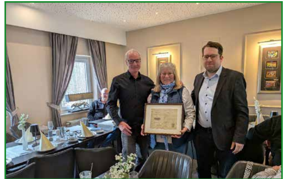
Die Urkunde erhält mit Sicherheit einen besonderen Platz